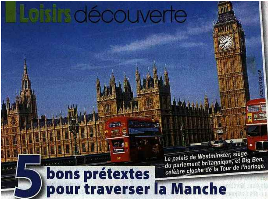
Le palais de Westminster, siège du parlement britannique, et Big Ben, célèbre cloche de la Tour de l'horloge.