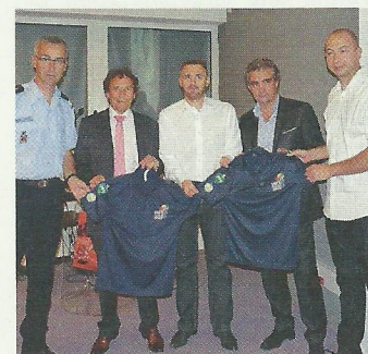
L'ASSE mobilisée en faveur des pompiers humanitaires

L'association Cœur Vert, officialisée il y a un an et demi pour regrouper l'ensemble des missions caritatives de l'ASSE, a remis officiellement aux Pompiers humanitaires français (PHF) leurs nouvelles tenues réalisées avec son concours et celui de l'association ResPublica. Cœur Vert soutient déjà depuis plusieurs années, à travers notamment son équipement, les Pompiers humanitaires français, association nationale née en 2005 à Saint-Etienne, où se concentre la majeure partie soit 80 % de son effectif en France. PHF, qui a son siège à Saint-Etienne, hébergé par le Sdis, a conduit 35 missions dont 15 d'urgence dans